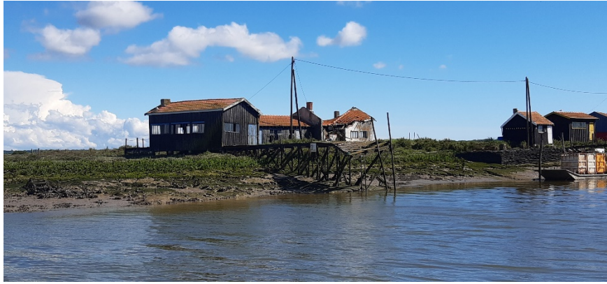
Les bâtiments en bois des pêcheurs d'Oléron