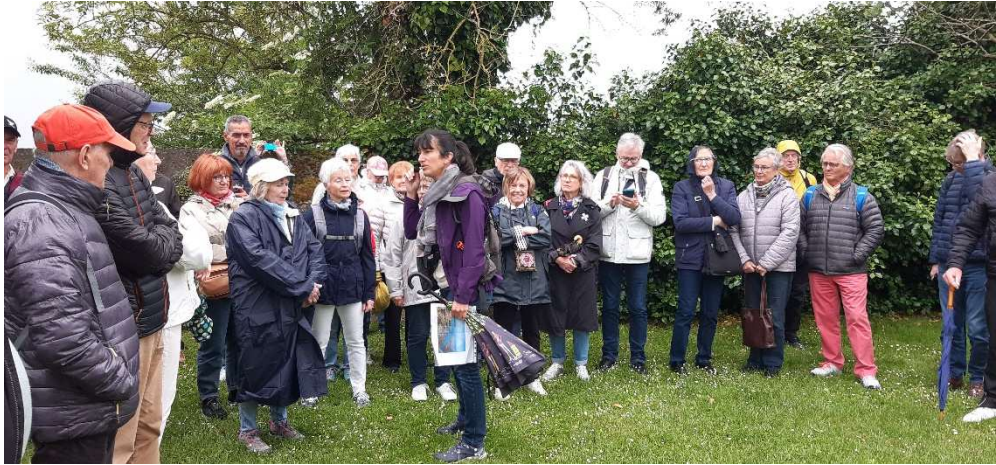
Notre guide explique toute l'histoire de l'église Saint-Pierre de Mornac