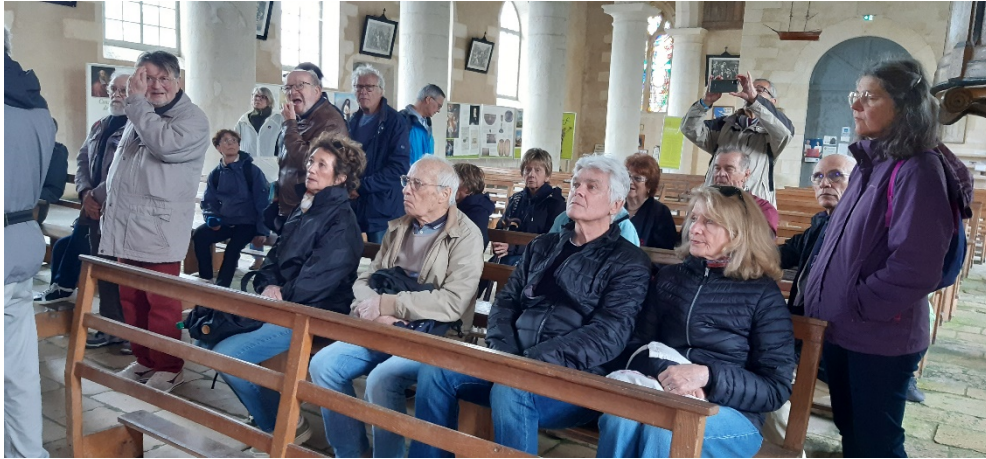
Les membres de la 3A écoutent religieusement les commentaires de la guide sur l'église de Brouage

Une suggestion du mari d'Annick Guinet (PeK) : « Pour les visites, les groupes de 40 c'est beaucoup notamment dans les villes où il y a du bruit, c'est difficile d'entendre les guides même s'ils utilisent un haut-parleur. »