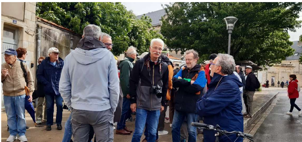
Des membres de TASA ont retrouvé par hasard dans la Rochelle un copain du CST en balade à vélo !

Une autre rencontre encore beaucoup plus improbable, a été pour des membres de TASA de retrouver à la descente du bus pour aller visiter la Rochelle, un ancien collègue de Toulouse habitant la très jolie ville charentaise se promenant à bicyclette. Le monde est petit, quelle belle surprise !