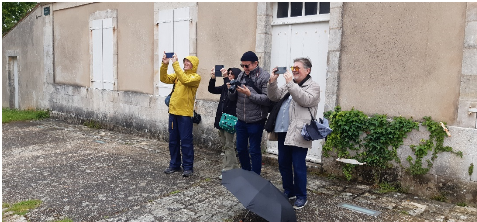
On immortalise avec le sourire le point de vue ou le monument

La deuxième région de métropole en termes d'ensoleillement (2200 heures en moyenne par an), sur une grande partie de la semaine « ne nous a pas gâté avec un temps pluvieux et frais » a commenté l'ensemble des participants. Même nos guides en ont été fortement surpris. Il faut sans aucun doute relativiser car la pluie a bien rempli les nappes phréatiques d'un très grand nombre de régions françaises au cours de l'hiver et du printemps 2023/2024.